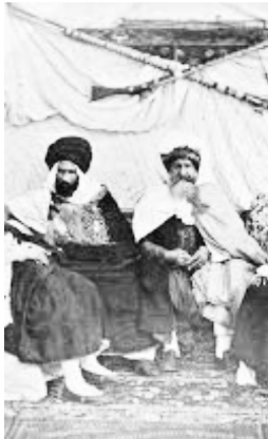
Par Med Soltane

C'est l'une des tribus qui se sont installées en Algérie La tribu des Hashem, histoire et origines